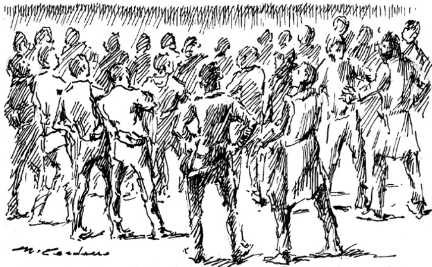
19 luglio 911: re Berengario I concede a un gruppo di Galliatesi di poter edificare un castello (disegno di Umberto Cardano)